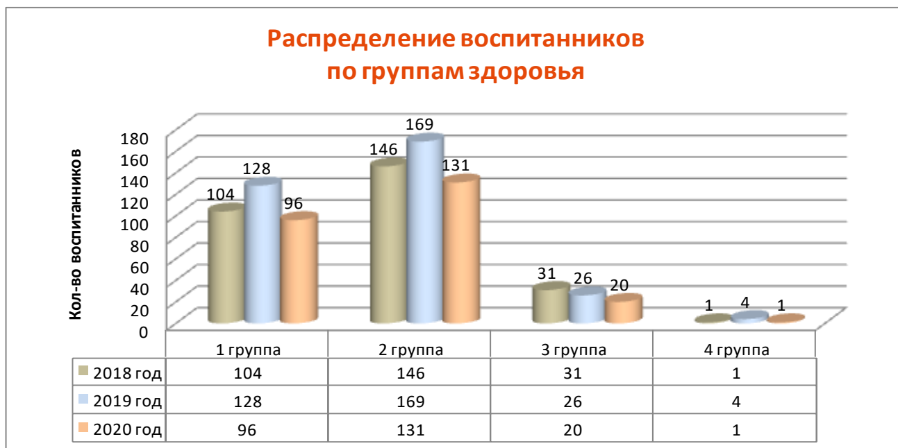
Рисунок 3. Распределение воспитанников по группам здоровья.

Анализ состояния здоровьесберегающей среды дошкольного образовательного учреждения. Базой для реализации ООП МБДОУ ДС № 57 «Радуга» и АООП МБДОУ ДС № 57 «Радуга» для детей с тяжёлыми нарушениями речи является укрепление физического и психического здоровья воспитанников, формирование у них основ двигательной и гигиенической культуры.