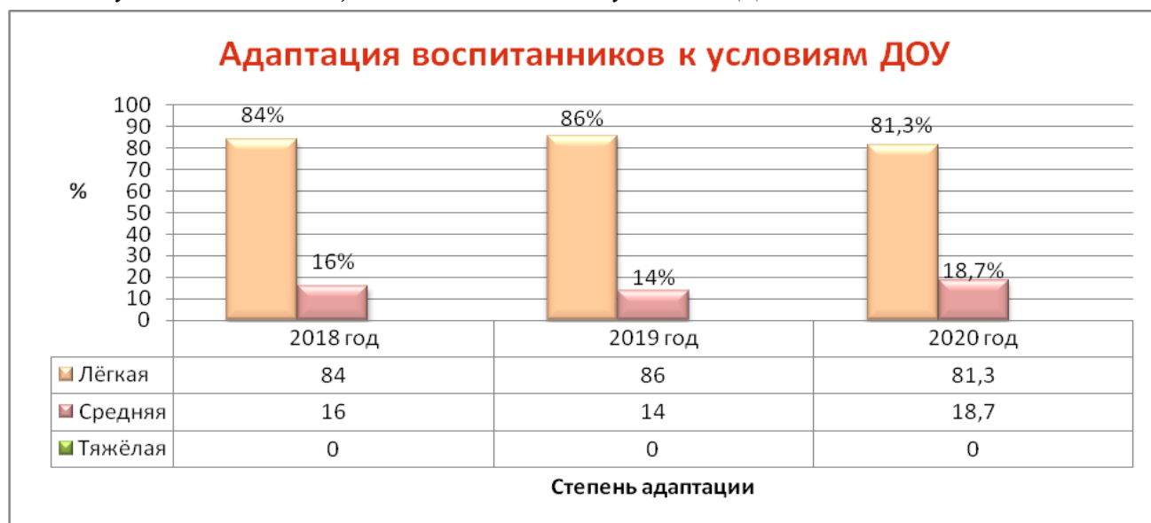
Рисунок 8. Адаптация воспитанников к условиям ДОУ

Мониторинг исследования психологического климата, состояния психологического благополучия в коллективе показал степень удовлетворенности педагогов жизнедеятельностью в образовательном учреждении. Средний показатель удовлетворённости в 2019 году составил 96,4% (в 2020 году – 96,6%), что говорит о стабильности в коллективе.