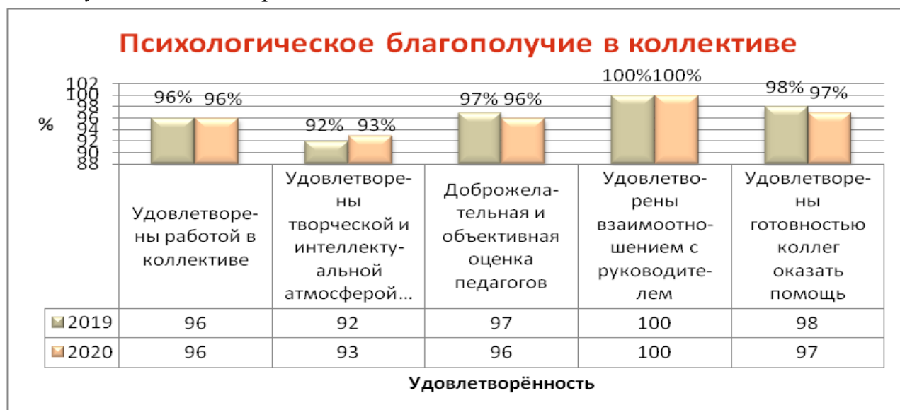
Рисунок 9. Мониторинг исследования психологического климата.

По результатам 2х этапов мониторинга «Оценка качества деятельности образовательных организаций Старооскольского городского округа» в режиме он-лайн анкетирования (письма управления образования администрации Старооскольского городского округа от 21мая 2020 года № 45-05-02-10/2921, от 24 ноября 2020 года № 42-05-02-10/7021 «О проведении мониторинга «Оценка качества деятельности образовательных организаций Старооскольского городского округа» МБДОУ ДС № 57 «Радуга» имеет следующие показатели: