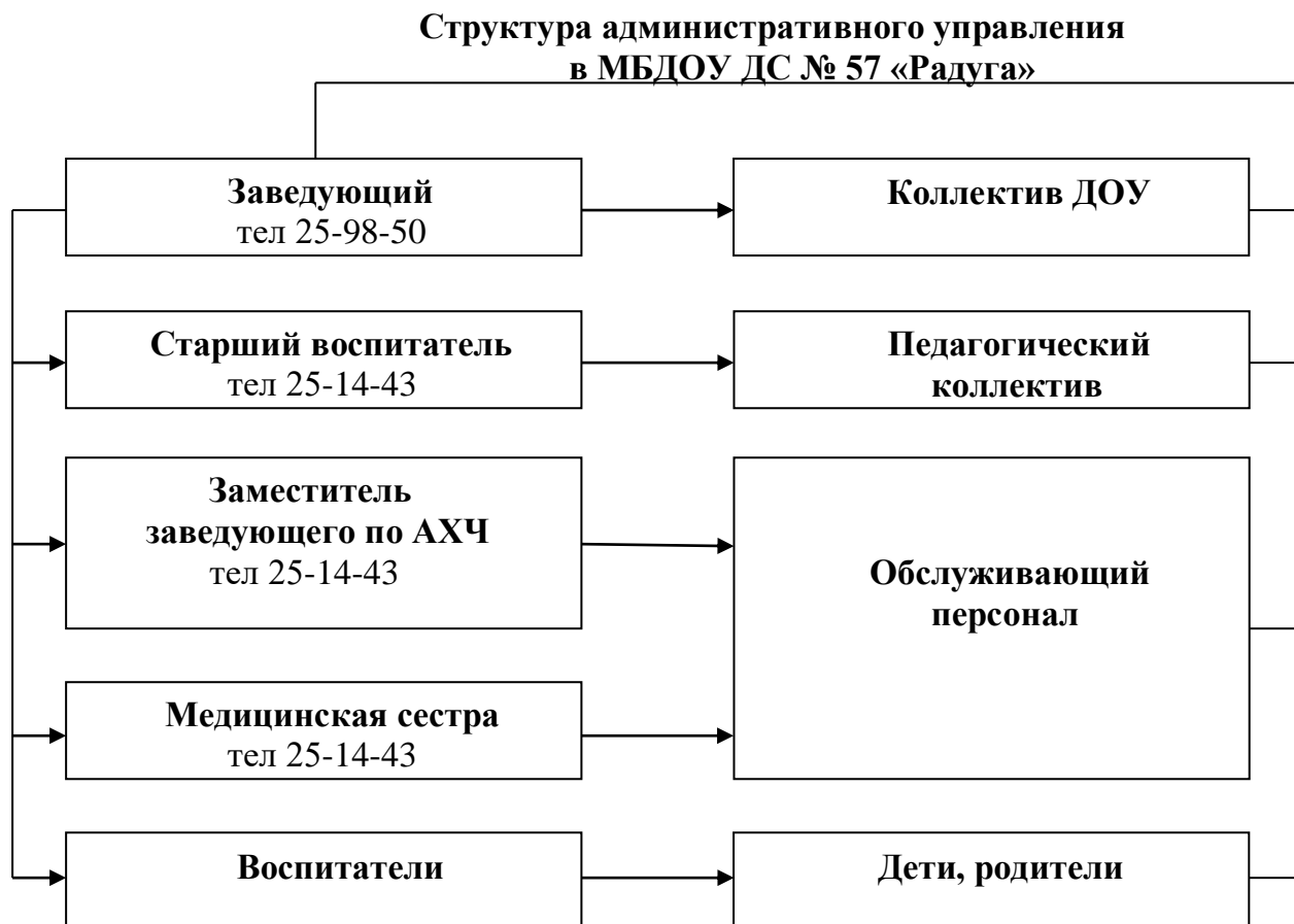
Таблица 2. Структура управления

Структура управления соответствует специфике деятельности образовательной организации.